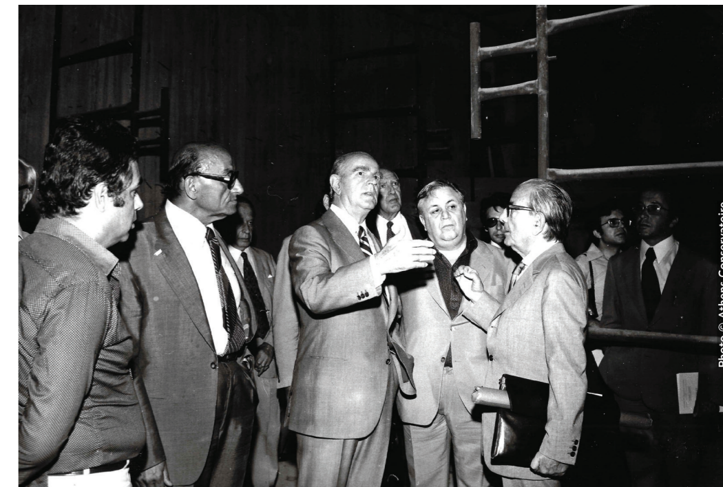
Από αριστερά στα δεξιά: Κώστας Σερέζης, Μενέλαος Παλλάντιος, Κωνσταντίνος Καραμανλής, Μάνος Χατζιδάκις, Ιωάννης Δεσποτόπουλος