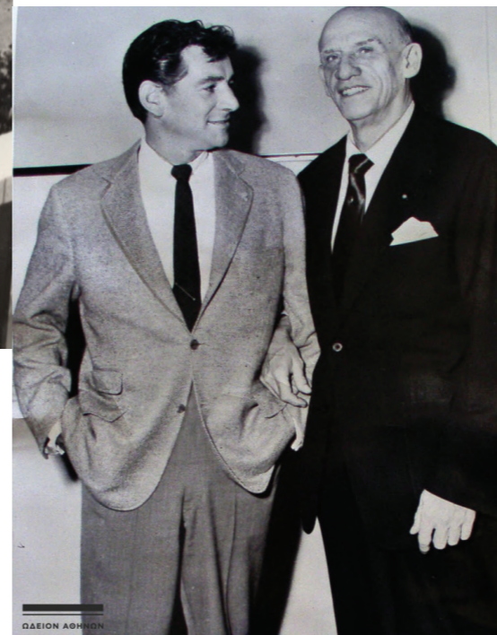
Από αριστερά στα δεξιά: Leonard Bernstein, Δημήτρης Μητρόπουλος